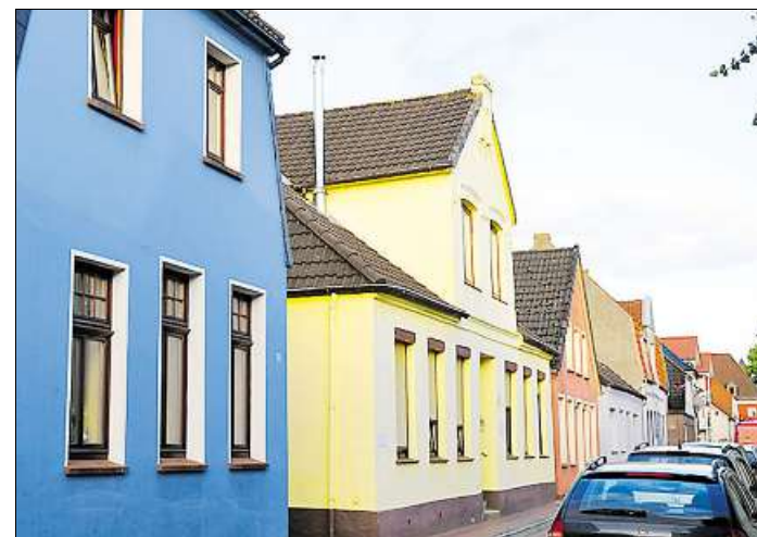
Im Gebäude Schüttingstraße 13 (gelbes Haus) befand sich von 1937 bis 1942 ein jüdisches Altenheim.