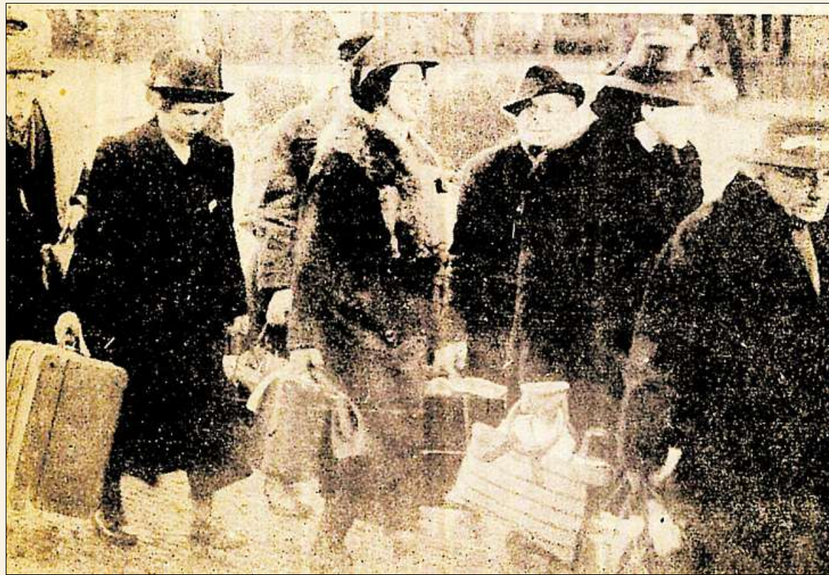
Der Abtransport der jüdischen Bürger geschah keineswegs im Geheimen: Über die Deportation der Emdener Juden berichtete die "Ostfriesische Tageszeitung" am 11. Februar 1942.

Deportiert wurden am 23. Juli 1942 aus dem Haus Schüttingstraße 13 in Varel ins Ghetto Theresienstadt, Durchgangsstation für Transporte in Vernichtungslager im Osten (Geburtsjahr in Klammern, Todesdatum wenn bekannt):