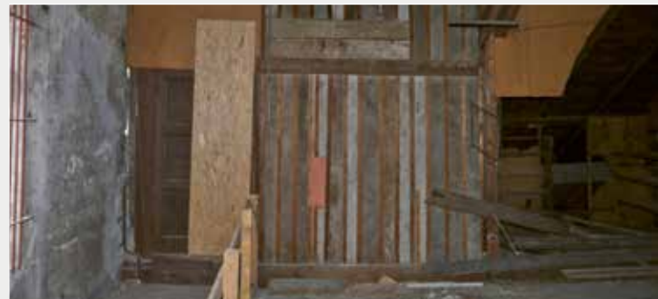
Der Holzverschlag auf dem Dachboden im Jahr 2015

rechts: Eva Basnizki geb. Hirche (1933-2016 Israel) 1935 auf dem Alten Markt vor dem Schild „Die Juden sind unser Unglück“