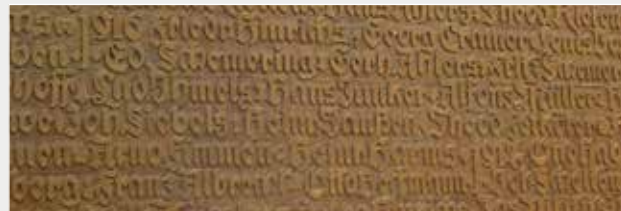
Gedenktafel für die im 1. Weltkrieg gefallenen ehemaligen Schüler

Das Gymnasium entwickelte sich bereits ab 1919 zu einem Zentrum des Antisemitismus, einige Lehrer hatten schon weit vor 1933 führende NS-Parteifunktionen inne. 1984 lud ein Projekt von Schülern und Lehrern der Schule vertriebene, überlebende Juden aus Jever zum Besuch ihres ehemaligen Wohnortes ein.