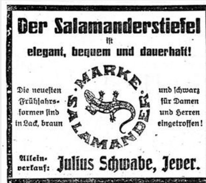
Anzeige von Julius Schwabe 1924