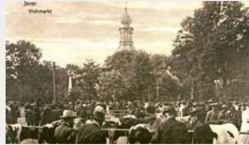
Der jeversche Viehmarkt um 1910