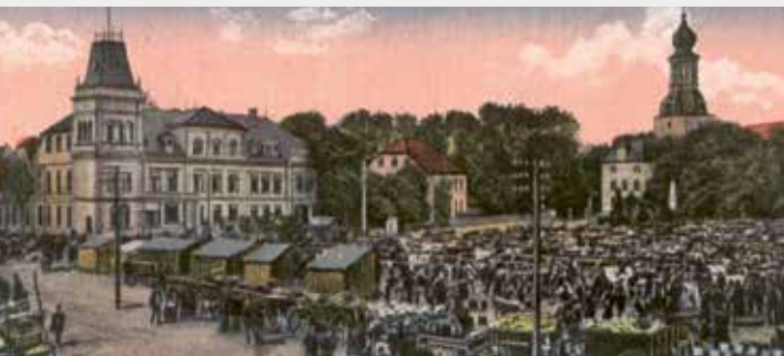
Der jeversche Viehmarkt um 1905

Die fruchtbare Marsch und die Vermarktung ihrer Produkte auf dem Geesthügel Jever sind hier gut zu erfassen. Die Viehmärkte blühten seit dem Bahnanschluss von 1871 und fanden ihr Ende im Weltkrieg 1914. Die Juden waren meist als Vieh- und Pferdehändler, Schlachter und in der Veredelung der Agrarprodukte tätig. Sie arbeiteten auch als Schneider, Kaufmann, Uhrmacher, Landwirt und abhängig beschäftigt.