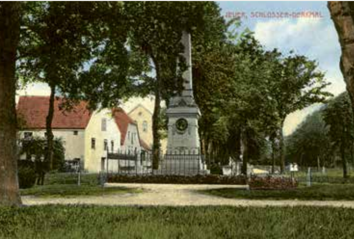
Der Schlosserplatz um 1915, 2. Haus v.l. das Gemeindehaus

Das jüdische Gemeindehaus auf der Rückseite der Synagoge diente in den 1930er Jahren als Altersheim. Beim Novemberpogrom 1938 zwang die SA die aus ihren Wohnungen verschleppten Juden auf dem Schlosserplatz zusammen und brachte sie anschließend in das Gefängnis.