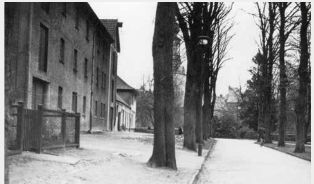
Das Gebäude der „S. Gröschler KG“ mit angrenzendem Wohnhaus von Julius und Hedwig Gröschler um 1934