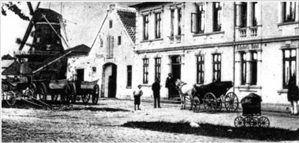
Das Bahnhofshotel mit der Viehwaage um 1900

Das „Bahnhofshotel“ war jahrzehntelang ein Mittelpunkt des geschäftlichen und sozialen Lebens von Nichtjuden und Juden.