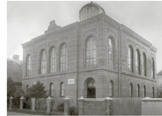
Die jeversche Synagoge um 1900