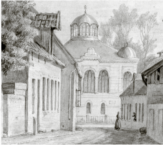
Die jeversche Synagoge in der Gr. Wasserpfortstraße (Zeichnung, 1881)