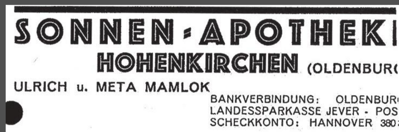
oben: Die Sonnen-Apotheke in Hohenkirchen auf einer Postkarte von 1931